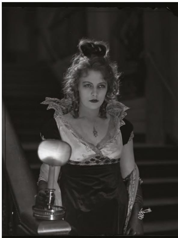
Gösta Berlings saga © AB Svensk Filmindustri (1924), Photo Julius Jaenson.