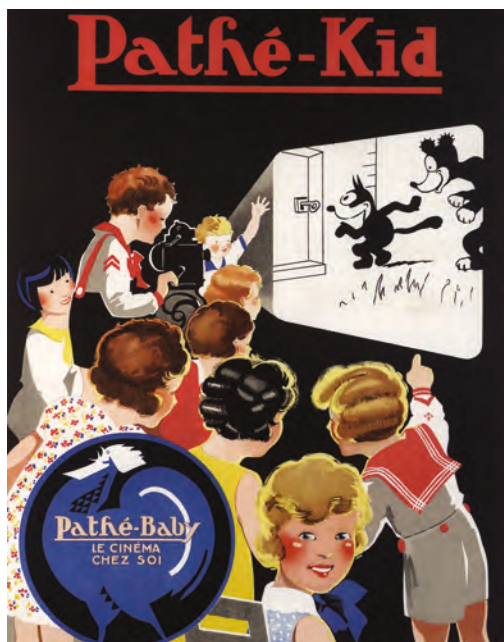
Publicité "Pathé-Kid"

Le Home cinema , une innovation récente ? Pas du tout ! L'année 2022 marque le centenaire du Cinéma chez soi . La Fondation Jérôme Seydoux Pathé célèbre cet anniversaire en dévoilant les secrets de cette révolution, fruit de l'idée de Charles Pathé de commercialiser, moins de trente ans après la naissance du cinéma, un projecteur élégant et simplissime employant une pellicule inédite, le 9,5 mm.