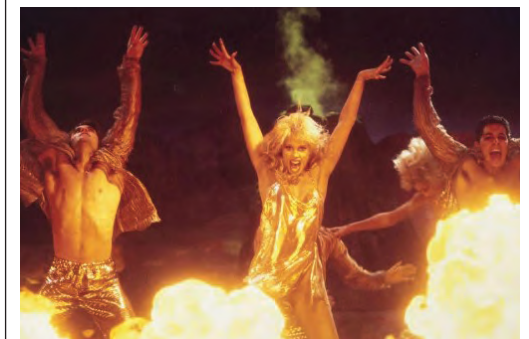
Obsessed with Light (Sabine Krayenbühl, Zeva Oelbaum, 2023). Droits réservés Sur un air de Charleston (Jean Renoir, 1926) © Tamasa Show Girls (Paul Verhoeven, 1995) © Pathé film