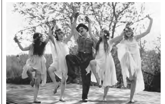
So This is Paris (Ernst Lubitsch, 1926) La Revue des revues (Joe Francis, Alex Nalpas, 1927) Sunnyside (Charles Chaplin, 1919)