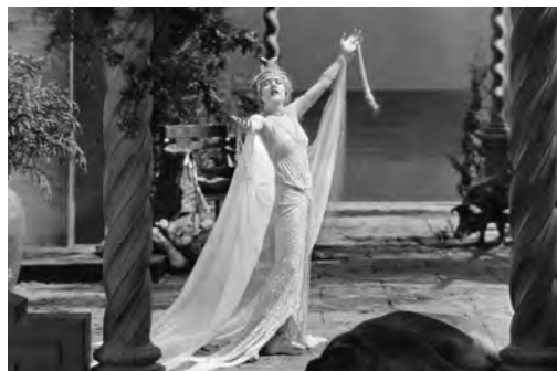
Circe the Enchantress (Robert Z. Leonard, 1924)

Sur inscription à l'adresse accueil@fondationpathe.com Entrée libre dans la limite des places disponibles (66 places)