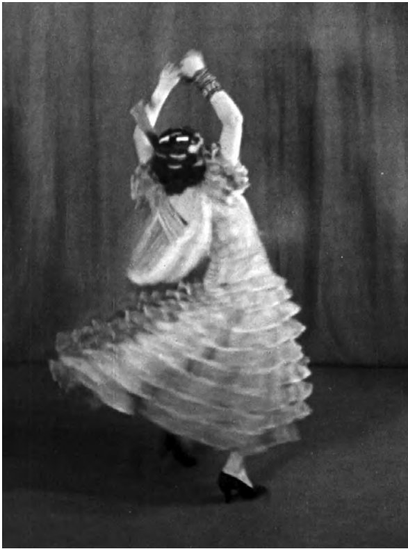
Danses espagnoles (Germaine Dulac, 1928)