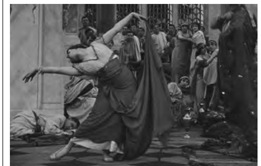
Ballett primadonna (Mauritz Stiller, 1916) Die Schwarze Loo (Max Mack, 1917) L'Étoile du Génie (Zecca, Leprince)