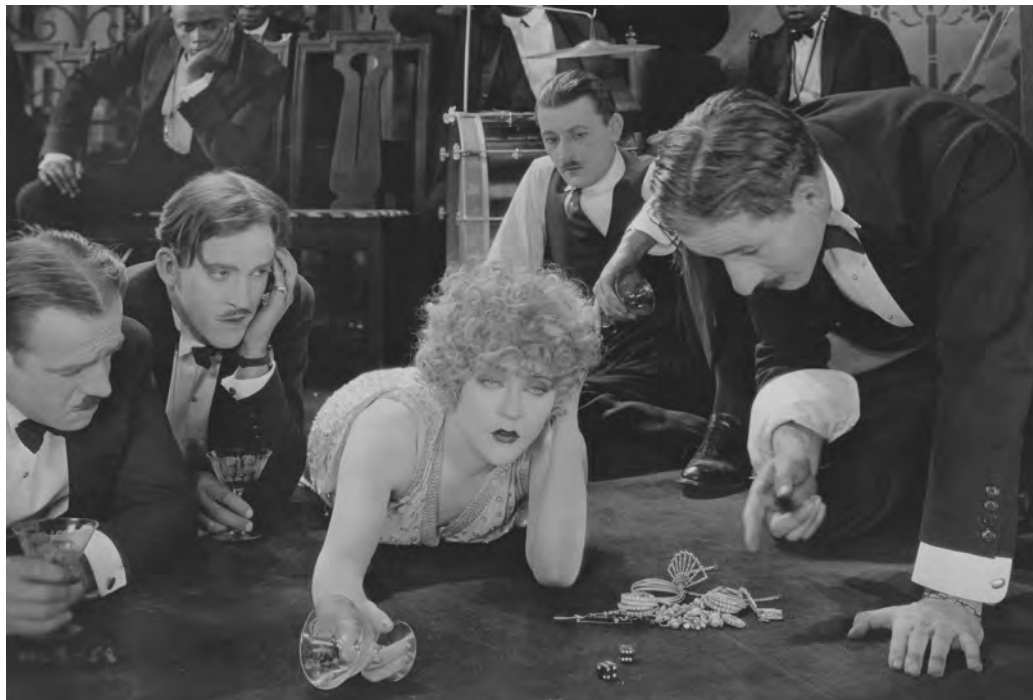
Circe the Enchantress (Robert Z. Leonard, 1924)