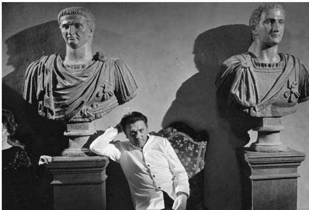
La dolce vita, collection Fondation Pathé © 1960, Pathé Films - Riama Film