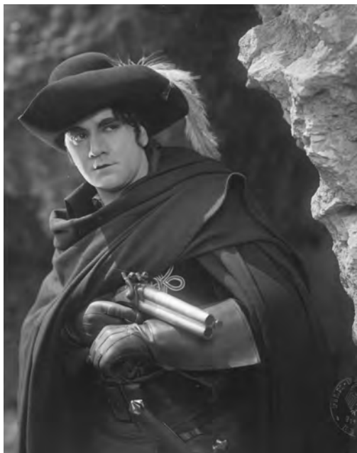
Zigano, der Brigant von Monte Diavolo (Harry Piel, 1925), Filmmuseum Düsseldorf.

Cette année, que ce soit par hasard ou à dessein, la 42 e édition des Giornate del Cinema Muto regorge de comédies et de films d'aventure — une évasion de premier ordre. Depuis les merveilles d'Harry Piel, aux spectaculaires cascades, jusqu'au seul long métrage des frères Fratellini, Rêves de Clowns (1924), en passant par le burlesque décomplexé de la courte parodie de Mack Sennett, When a Man's a Prince (1926), les films projetés cette année, tant à Paris qu'à Pordenone, reflètent l'étonnante diversité du cinéma international à l'époque du muet. Ce qui ne veut pas dire que nous ne projetons que des films dits populistes : ainsi, on trouve aussi le chef-d'œuvre de Louis Feuillade, Vendémiaire (1918), dans une nouvelle restauration par Gaumont réalisée à partir de la copie nitrates originale, ainsi que le superbe drame de William de Mille, Conrad in Quest of His Youth (1920), dans une nouvelle restauration de la Library of Congress.