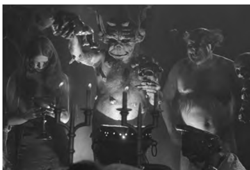
Plaque de lanterne magique, circa 1900 Quatre-vingt-treize (Albert Capellani, André Antoine, 1914), Häxan, la sorcellerie à travers les âges, Benjamin Christensen, 1922.