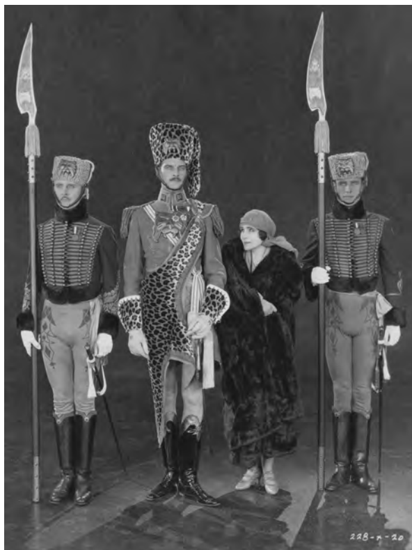
The Only Thing (Jack Conway, 1925)