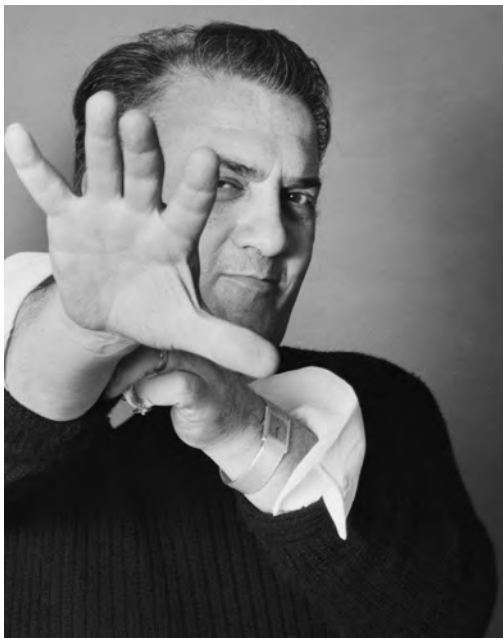
Federico Fellini, Photo Elisabetta Catalano, 1973. Collection Archivio Elisabetta Catalano.

FELLINI : MAESTRO ! JUSQU'AU 27 JAN. 2024