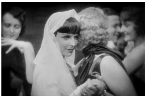
Loulou (G. W. Pabst, 1928)

C'est à Lotte H. Eisner, journaliste et critique de cinéma berlinoise, exilée en 1933 et devenue une des collaboratrices essentielles d'Henri Langlois dès la création de la Cinémathèque française, qu'on doit le beau titre L'Écran démoniaque , celui d'un livre écrit au début des années 1950 mais publié dans son intégralité en 1965. Il désigne un ensemble de films réalisés en Allemagne après 1918 : un pays vaincu et occupé, où une révolution avortée, le chômage, l'inflation, l'assassinat politique scandaient l'actualité. L'arrivée au pouvoir de Hitler allait mettre fin à la première république allemande après moins de quinze ans.