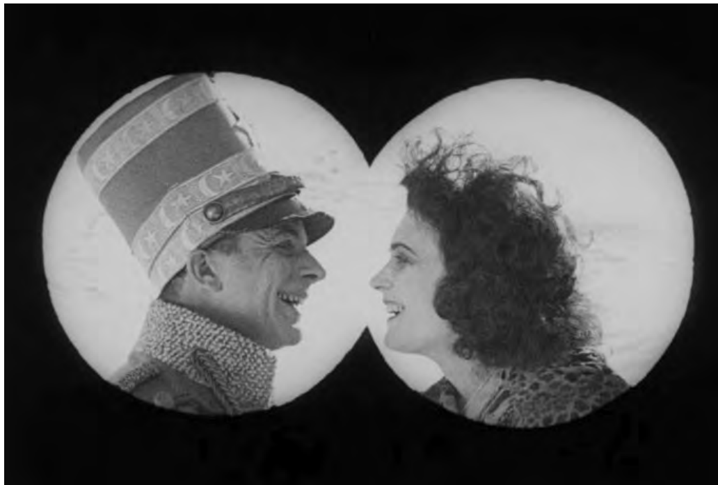
La Chatte des montagnes (Ernst Lubitsch, 1921)