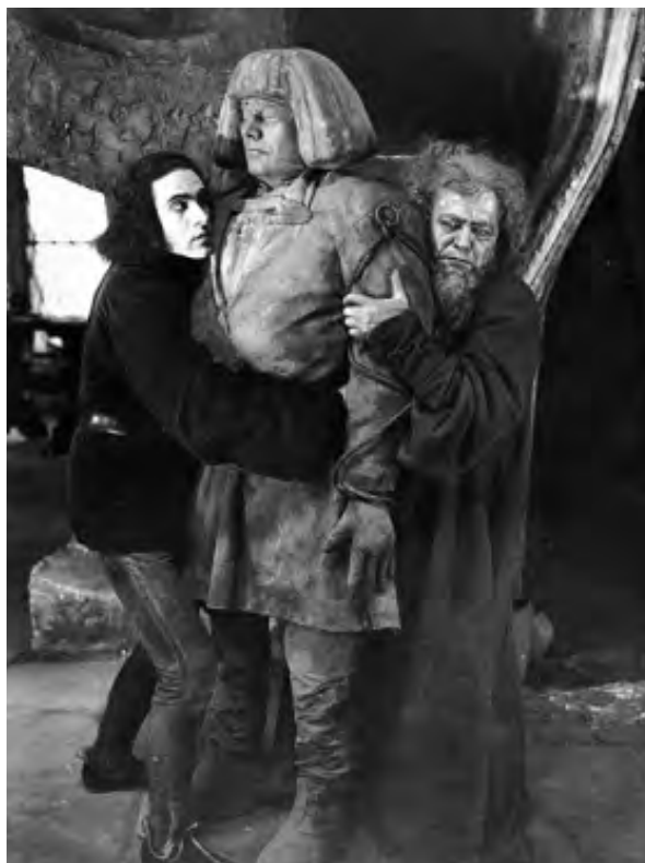
Le Golem (Paul Wegener, 1920)