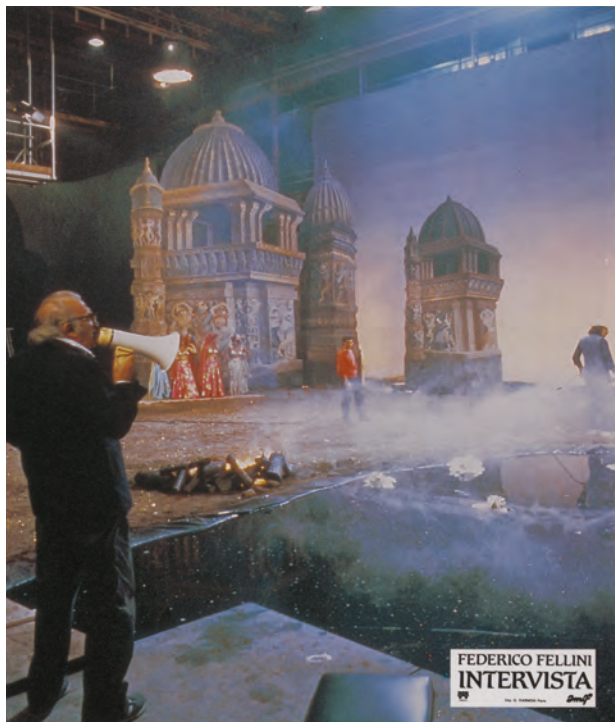
Intervista, collection Fondation Pathé © 1987, Aljosh Productions