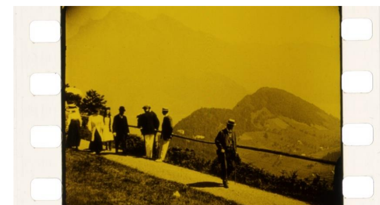
Actualités Ciné-journal suisse